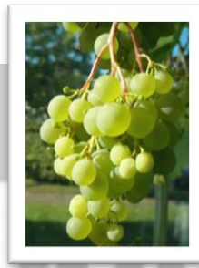
Zalas Perle ,

geplant, voor de toekomstige experimentele productie witte -en mousserende wijn.