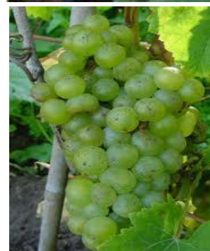
Madeleine Angevine 7672