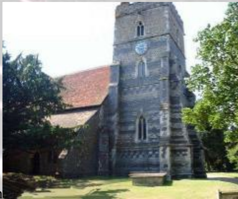
All Saints Church

Elk jaar kwamen er veel meer wijngaarden bij. Engelse wijngaarden namen een stijging van de groei in tot 1066, wanneer de Noormannen binnen vielen brachten ze een orde van monniken mee die wijngaarden aanplantten in hun kloostertuinen om meer wijn te maken voor dagelijks gebruik. Veel van die wijngaarden zijn opgenomen in het Doomsday Book van 1086 als zijnde eigendom van de Kroon .