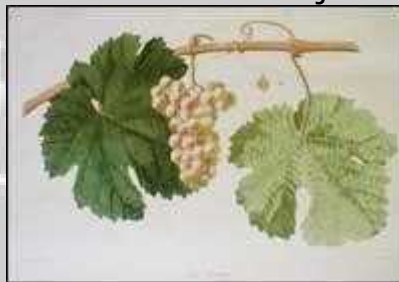
Riesling (Rhine Riesling),