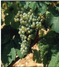
Marsanne blanche (lokale naam Ermitage) en de Malvoisie (Pinot gris).