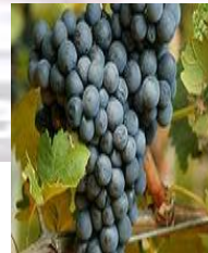
Humagne rouge ,

en enige onbekendere lokale druiven, zoals