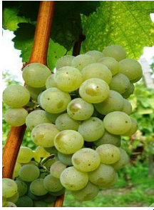
Sylvaner (hier Johannisberg genoemd),