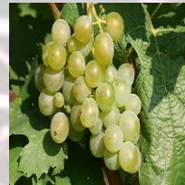
Muscat blanc .

Er worden ook dessertwijnen gemaakt met de