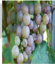
Amigne en de