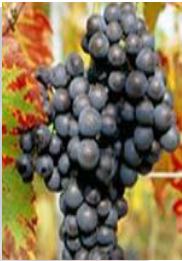
Mondeuse (lokaal Eyholzer rote genoemd).